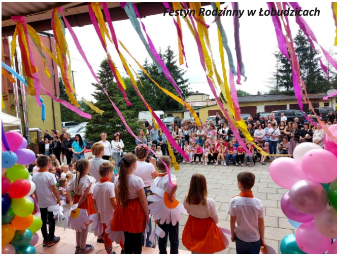
Festyn Rodzinny w Łobudzicach

Większość przedsięwzięć odbywa się pod Honorowym Patronatem Burmistrza Zelowa, a na ich organizację sołectwa pozyskują środki od partnerów, a także przekazują część funduszu sołectkiego.