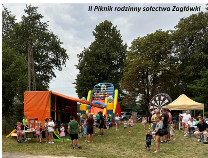
II Piknik rodzinny sołectwa Zagłówki