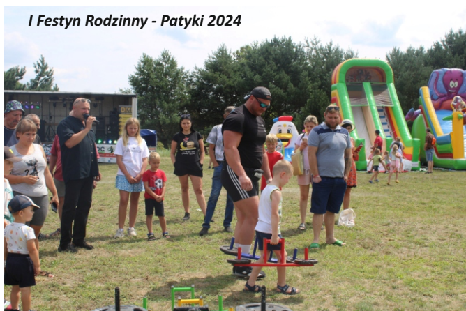
I Festyn Rodzinny - Patyki 2024