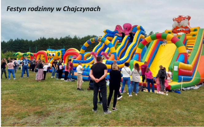
Festyn rodzinny w Chajczynach

Niemal w każdy weekend na terenie naszej gminy odbywają się pikniki i festyny rodzinne dla mieszkańców. Słoneczna pogoda sprzyja nie tylko spotkaniom, ale również rozwijaniu pasji i wymianie doświadczeń. Niejednokrotnie dzięki Kołom Gospodyń Wiejskich uczestnicy wydarzeń mogą skosztować lokalnych potraw i wypieków oraz spróbować swoich sił podczas różnorodnych warsztatów, czy sportowych zmag-