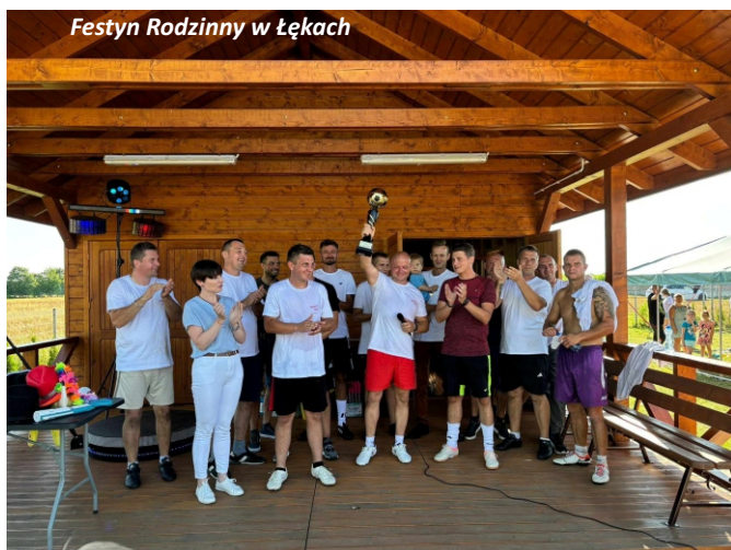
Festyn Rodzinny w Łęczach