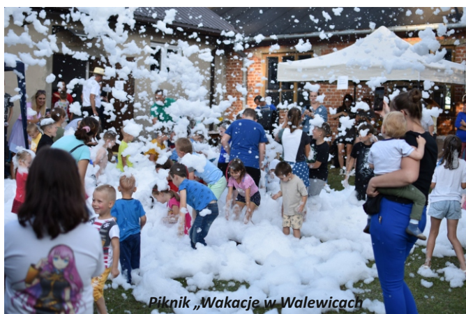
Piknik „Wakacje w Walewicach