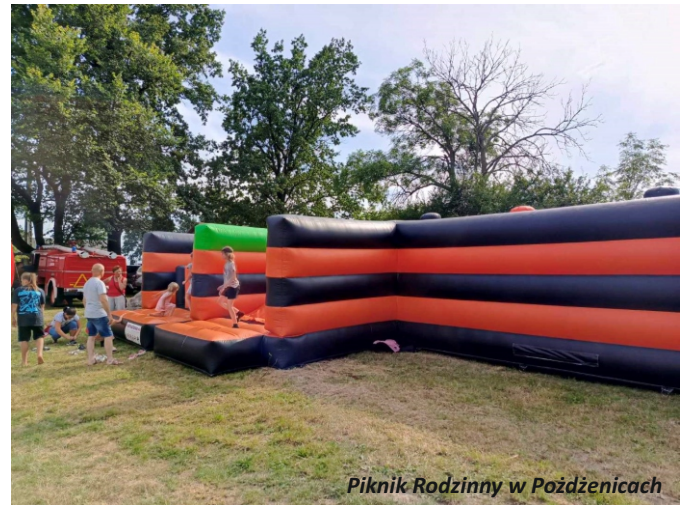
Piknik Rodzinny w Pozdżenicach