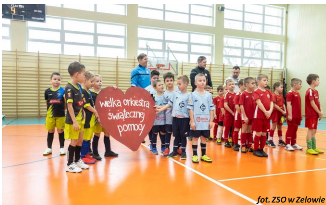
fol. ZSO w Żelowie

Przedsięwzięcie zostało objęte honorowym patronatem Burmistrza Żelowa Tomasza Jachymka.