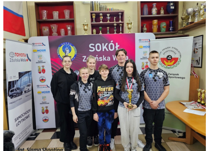
fol. Sigma Shooting