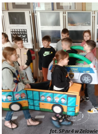
fot. SP nr 4 w Zelowie

Kierując „Autochodzikami” przekonali się jak poruszają się samochody na jezdni i czym są pojazdy uprzywilejowane. Wszyscy świetnie się bawili. Po lekcji pełnej wrażeń udało się przez chwilę pobyt w służbowym samochodzie, którym strażnicy miejscy na co dzień poruszają się po mieście pilnując porządku publicznego. Uczniowie obejrżeli też pomieszczenie, w którym znajduje się monitoring, a oficer dyżurny przyjmuje zgłoszenia od mieszkańców.