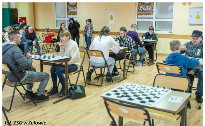
fol. ZSO w Żelowie