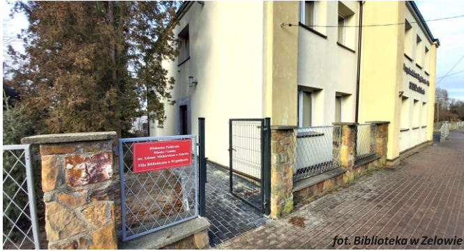
fot. Biblioteka w Zelowie

udało się sprawnie w ciągu 3 dni przenieść wszystkie elementy wyposażenia i ponad 5 tys. książek do nowego lokalu filii bibliotecznej. Nowe godziny otwarcia Filii: Wtorek - 11:00 - 16:00 Środa - 9:00 - 14:00 Czwartek - 11:00 - 16:00 Piątek - 9:00 - 14:00 III Sobota miesiąca 9:00 - 13:00