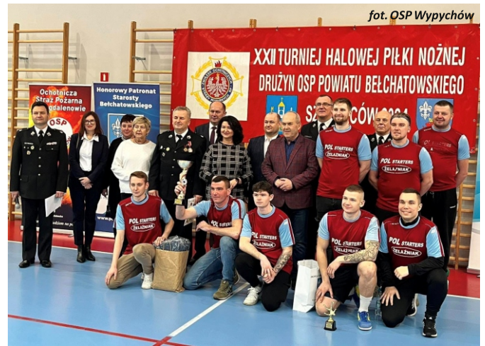
fol. OSP Wypychów

Turniej został objęty Honorowym Patronatem Burmistrza Zelowa Tomasza Jachymka.