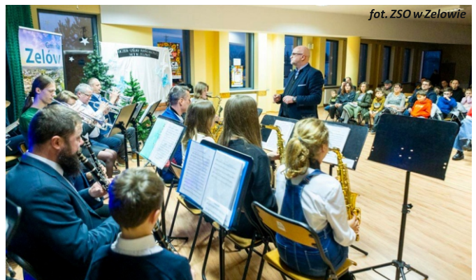
fol. ZSO w Żelowie