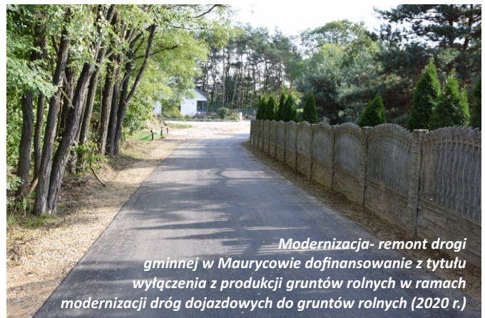
Modernizacja- remont drogi gminnej w Maurycowie dofinansowanie z tytułu wyłączenia z produkcji gruntów rolnych w ramach modernizacji dróg dojazdowych do gruntów rolnych (2020 r.)

Budowa wodociągu, kanalizacji i nawierzchni drogi ul. Brzozowa. Dotacja PROW (2023 r.)