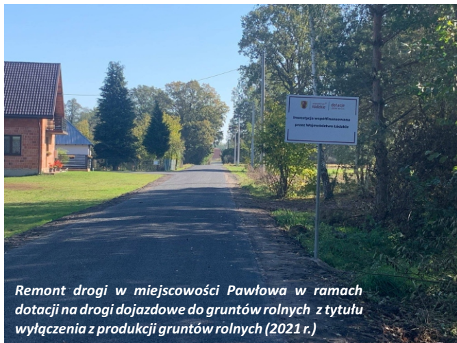
Remont drogi w miejscowości Pawłowa w ramach dotacji na drogi dojazdowe do gruntów rolnych z tytułu wyłączenia z produkcji gruntów rolnych (2021 r.)

Budowa sieci wodociągowej wraz z odgałęzieniami w granicach pasów drogowych w gm. Zelów, msc. Ostoja, Kolonia Grabostów, Kolonia Ostoja współfinansowana ze środków PROW (2020 r.)