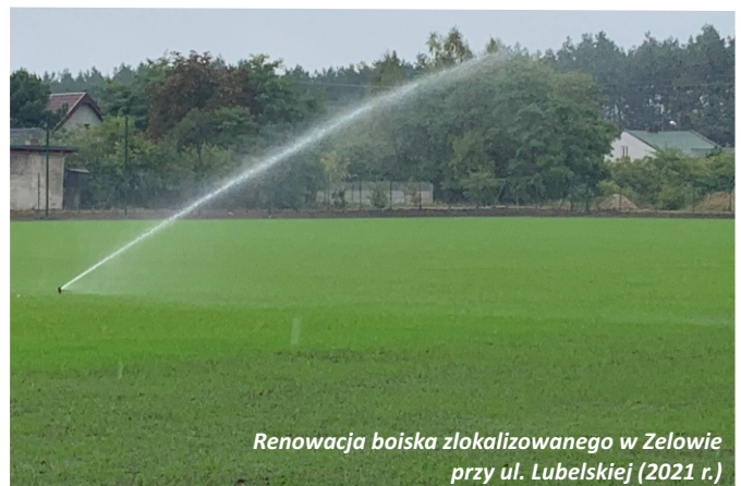
Renowacja boiska zlokalizowanego w Zelowie przy ul. Lubelskiej (2021 r.)

Budowa altany w Łękach współfinansowana ze środków LGD Dolina rzeki Grabi w ramach PROW (2023 r.)