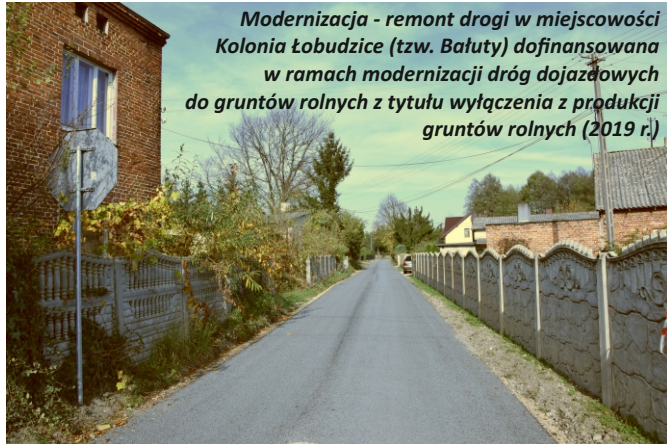
Modernizacja - remont drogi w miejscowości Kolonia Łobudzice (tzw. Bałuty) dofinansowana w ramach modernizacji dróg dojazdowych do gruntów rolnych z tytułu wyłączenia z produkcji gruntów rolnych (2019 r.)

Poniżej część z inwestycji realizowanych w naszej gminie od początku 2019 roku dzięki wsparciu finansowemu Urzędu Marszałkowskiego Województwa Łódzkiego.