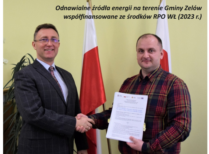
Odnawialne źródła energii na terenie Gminy Zelów współfinansowane ze środków RPO WŁ (2023 r.)

Doposażenie boiska zlokalizowanego w Zelowie przy ul. Lubelskiej w sprzęt sportowy dofinansowane ze środków Urzędu Marszałkowskiego w Łodzi w ramach „Infrastruktura sportowa Plus” (2023 r.)